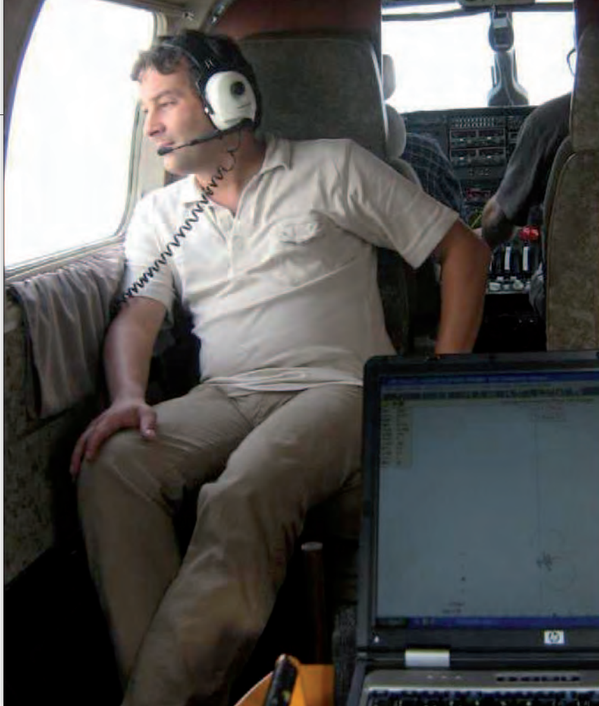
Prezes Zarządu podczas lotu – siła spokoju

wy systemu LPIS w Polsce. Program jest największym wieloletnim przedsięwzięciem, w jakim spółka brała i nadal bierze udział. Łącznie w ramach LPIS wykonaliśmy cyfrowe i analogowe zdjęcia dla 200 tys. km 2 powierzchni kraju.