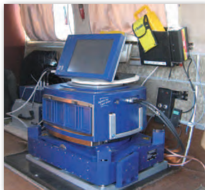
Kolejna kamera na pokładzie Pipera Navajo. Kamery się zmieniają, a on wciąż ten sam...