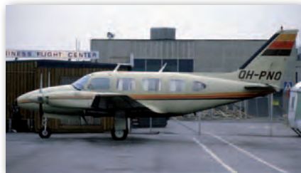
Piper Navajo tuż przed przebazowaniem do Polski. Na drugim planie proroczy znak dobrego kierunku podjętych działań: „business flight center”

Już w maju, czyli bezpośrednio po zarejestrowaniu spółki (kwiecień), mieliśmy do dyspozycji własny samolot. Niestety, nikt w firmie nie zdawał sobie sprawy, że do wykonania pierwszych zdjęć (panchromatycznych, analogowych)