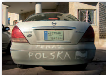
Na obcej ziemi...

Zarówno doświadczenia rumuńskie, jak i rozwój polskiego rynku przekonały nas, że jeżeli chcemy myśleć o dalszym rozwoju, musimy mieć drugi samolot. W przypadku awarii czy projektu zagranicznego byliśmy bezradni, unieruchomieni. Tak więc w lutym przejeżdżaliśmy z warszawskiego Polkartu kompletny zespół fotolotniczy: samolot, kamerę, wyposażenie i pilota z operatorem. Nie był to jednak koniec inwestycji. Przewidując zmierzch ery analogowej, w czerwcu kupiliśmy pierwszą kamerę cyfrową Intergraph DMC i jeszcze w tym samym miesiącu wykonaliśmy projekt badawczy dla SGGW. Nie obyło się jednak bez problemów, gdyż pierwszy wniosek o dofinansowanie złożony w 2006 roku został odrzucony z przyczyn formalnych i dopiero za drugim razem udało się skorzystać z funduszy UE. Bardzo szybko okazało się, że była to dobra inwestycja i niezbędny krok, bo już niewiele ponad rok później wszystkie nasze kamery analogowe odłożyliśmy do lamusa, a ostat-