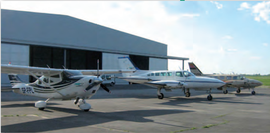
Flota MGGP Aero - trzy maszyny gotowe do startu

amerykańską konstrukcją Cessna 206. Sprowadzenie jej w kwietniu z USA do Polski nie odbyło się bez przygód [GEO-DETA 6/2010 – red.], ale już w czerwcu została wpisana do AWC spółki i rozpoczęła realizację pierwszych projektów.