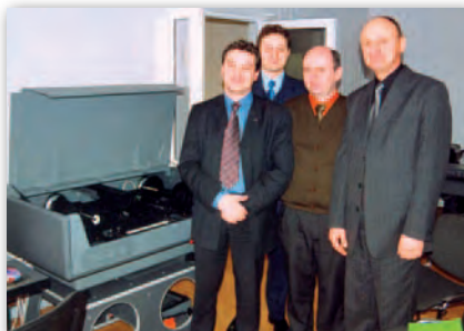
Wizyta w Winnicy i zakup pierwszego skanera