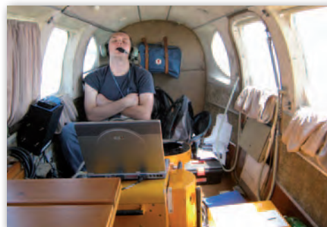
Zakup nowego systemu znacząco ograniczył pracę fotooperatora