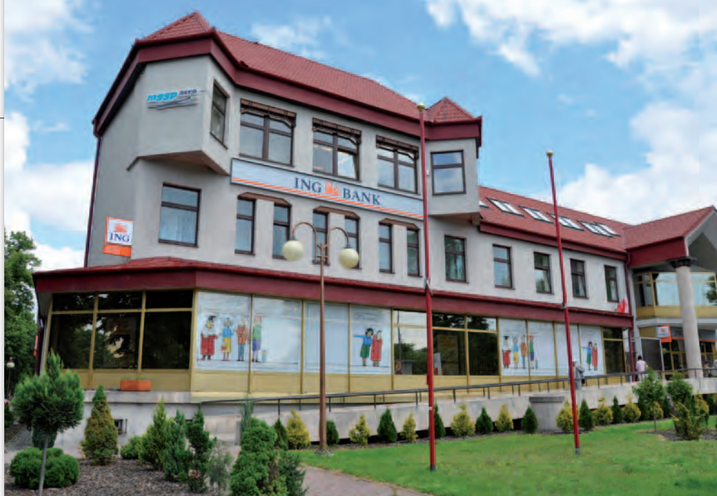
Obecna siedziba MGGP Aero

W sumie na koniec roku spółka zrealizowała już ponad 150 projektów i zatrudniała 40 pracowników. Przełom 2008 i 2009 roku to ścisła współpraca z Grupą Onet.pl SA i bardzo duże projekty związane z wrzuceniem do serwisu lokalizacyjnego Zumi.pl archiwalnych zdjęć lotniczych oraz wykonanie na specjalne zlecenie nowych obiektów. Wreszcie nasze zdjęcia trafiają do masowego odbiorcy. Firma jest coraz bardziej rozpoznawalna na rynku, a zdjęcia MGGP Aero znajdują uznanie u ponad 3 milionów użytkowników miesięcznie (w 2011 roku już prawie 5 milionów). Coraz częś-