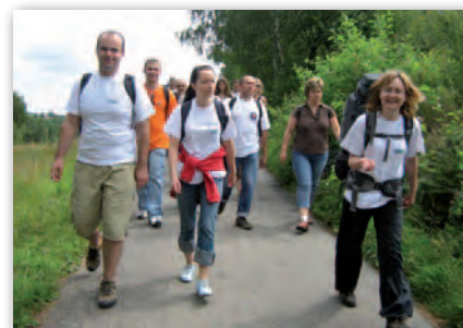
Gdzieś na szlaku I Rajdu MGGP Aero

2007 rok przyniósł jeszcze jedno bardzo ważne wydarzenie – I Rajd MGGP Aero. Młody, nowy i wciąż powiększający się zespół wymagał lepszego zgrania, wzajemnego poznania się, nawiązania bliższych relacji, dlatego od tamtej pory regularnie spotykamy się nie tylko w biurze, samolocie, ale również po pracy, w wolnym czasie. Poza corocznym