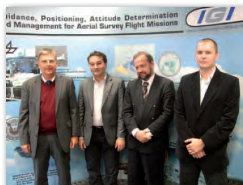
Zakup systemu LiDAR w spółce IGI w Niemczech

projekt. Decyzja o rozwijaniu skaningu laserowego okazała się na tyle trafna, że – uwzględniając ogromne zapotrzebowanie rynku – niewiele ponad rok później zakupiliśmy kolejny system LiDAR. Dużą zasługę mieli w tym nasi pracownicy, którzy w miarę poznawania nowej tech-